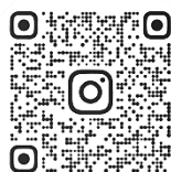
山口県作業療法士会 公式 Instagram