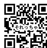
それっっちゃデジタル版