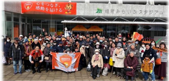
未来をつなぐ糸(ITO)「継続中」