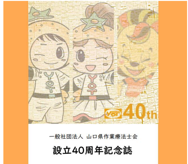
一般社団法人 山口県作業療法士会 設立40周年記念誌

山口県作業療法士会設立40周年記念誌が完成いたしました。会員の皆様には CD-R で「データ版」という形で今月号のそれっちゃやまぐちに同封しています。CD-R のインデックスカードに QR コードを載せているので、スマートフォンで読み取っていただくと、県士会 HP から確認できるようになっています。関係団体からのお祝いの言葉や、山口県士会のこれまでのあゆみ、県士会皆様からお預かりしたメッセージカード集なども入っています。