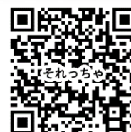
それっちやデジタル版