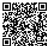
山口県作業療法士会 LINE 公式アカウント