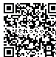
それっちゃデジタル版