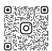
山口県作業療法士会 公式 Instagram