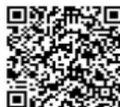
登録フォーム用 QR コード

登録フォーム URL： https://forms.gle/nHBPDMPT4i6Z6XLv8