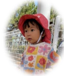
文責 : 吉長