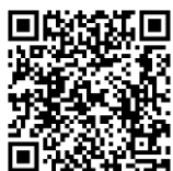
山口県作業療法士会 LINE 公式アカウント