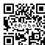
それっちゃデジタル版